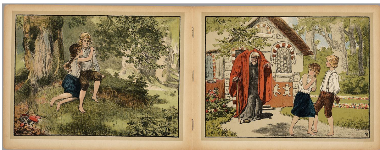
Biblioteka dla Dzieci i Młodzieży nr 51: Ilustracja książkowa : Jaś i Małgosia (bibrem51.blogspot.com)

Popatrzmy na kilka wątków z baśni, które pozwolą nam zobaczyć, w jaki sposób wnosi ona ważne dylematy obecne w życiu człowieka. Znana wszystkim baśń o „Jasiu i Małgosi” już na wstępie ukazuje trudną sytuację życiową rodziny, która prowadzi rodziców do okrutnej myśli, aby pozbyć się dzieci, porzucając je w lesie. Dzieci przeczuwają nieszczęście, udaje się im wyratować z pierwszej takiej sytuacji, dzięki sprytnemu pomysłowi Jasia (znaczenie drogi kamykami). Za drugim razem odnoszą niepowodzenie, a pomysł Jasia, aby zapobiec tragedii, jest nietrafiony (chłopiec znaczy drogę okruchami chleba, które zjadają ptaki).