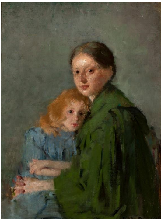
Olga Boznańska (1865–1940)

W omawianej tutaj baśni dzieci znajdują rozwiązanie, udaje im się przechytryć wiedźmę i ukarać ją. Uruchamiają „własne zasoby”, w celu ratowania siebie, przestają być bierne. Przy czym rozwiązania te mogą wydawać się drastyczne – czarownica zostaje spalona we własnym piecu! Jednak dopiero wtedy udaje się dzieciom wrócić do domu, zło – ucieleśnione w osobie czarownicy – zostaje pokonane. Jedną z najczęściej wysuwanych interpretacji jest tutaj odniesienie do sposobu w jaki dziecko na pewnym etapie rozwoju przeżywa matkę, rodziców. Kiedy napotyka ono odmowę, odroczenie jakiejś przyjemności, mama, która wcześniej była w umyśle dziecka postrzegana jako dobra, opiekuńcza, zamienia się „na jakiś czas” w „wiedźmę” (bo odmówiła dziecku czegoś). Aby móc „wrócić” do dobrej mamy – dziecko musi rozprawić się w sobie z tym doświadczeniem złej mamy, czyli poradzić sobie z napływającymi uczuciami złości, rozczarowania, smutku.